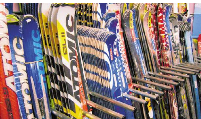
OB ANFÄNGER ODER RENNFÄHRER: Die Auswahl an Skiern ist groß